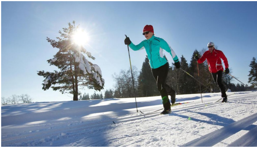
Langlauf Baiersbronn Schwarzwald