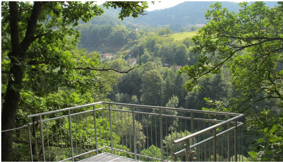
Blick von der Plattform ins Obertal