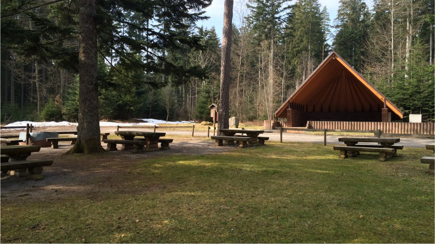
Grillplatz Reute