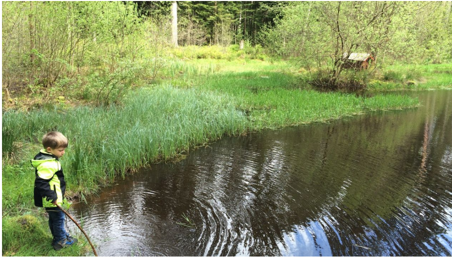
am Möhrlesee