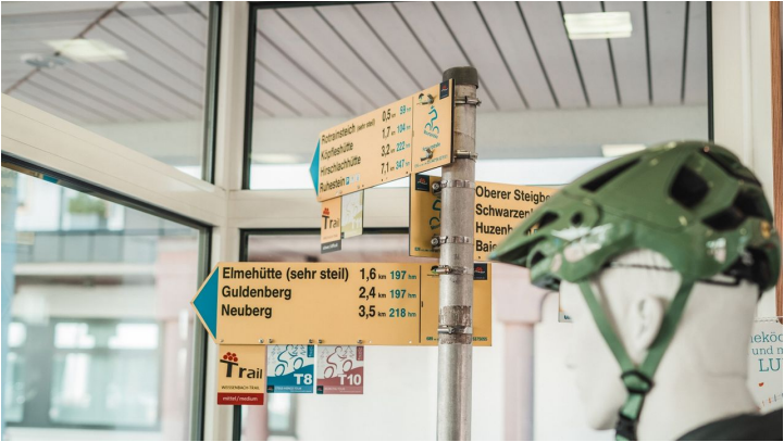
MTB Beschilderung in Bayersbronn - © Max Günter, Nationalparkregion Schwarzwald - Bayersbronn / Murgtal