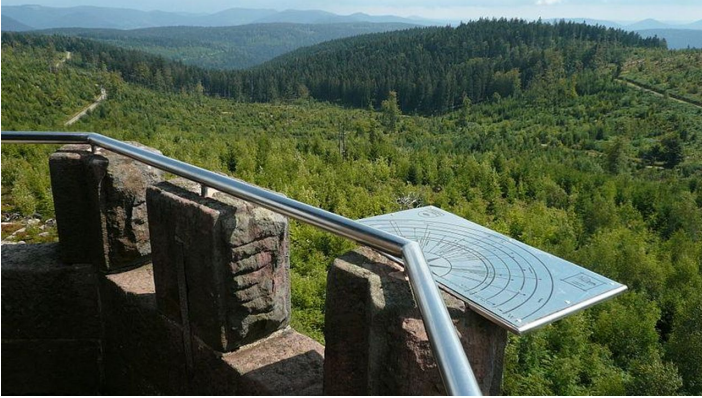
Ausblick vom Moosturm