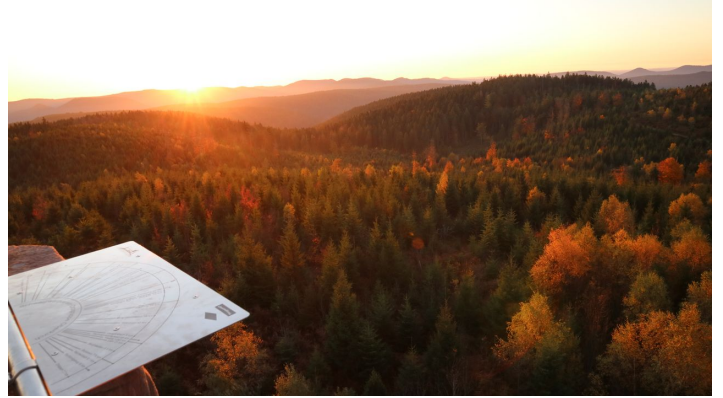
Nadine Fund, Nationalparkregion Schwarzwald - Renchtal/Durbach