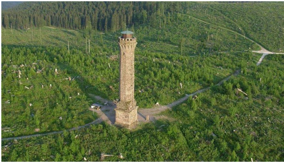
Nadine Fund, Ortenau Tourismus