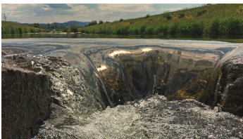
Rensch - © Pro-cyCL - Professional cycling Christian Ludewig, www.pro-cycl.de