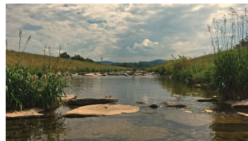
Rensch - © Pro-cyCL - Professional cycling Christian Ludewig, www.pro-cycl.de