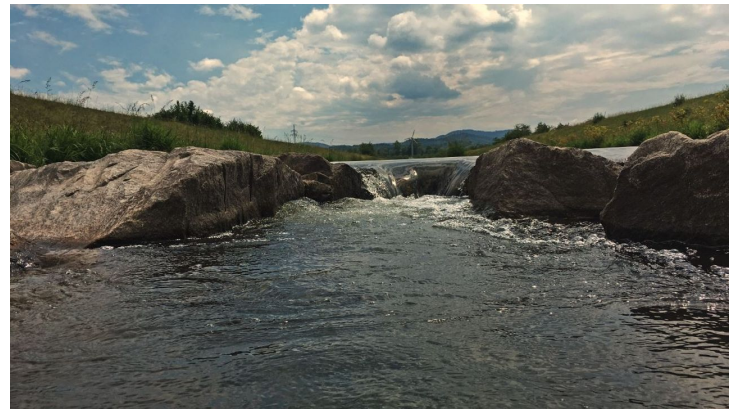
Rensch - © Pro-cyCL Professional cycling Christian Ludewig, www.pro-cycl.de