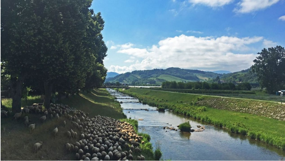
Schafe an der Rensch