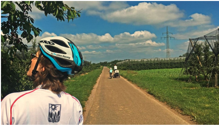
Radfahrer auf dem Radweg