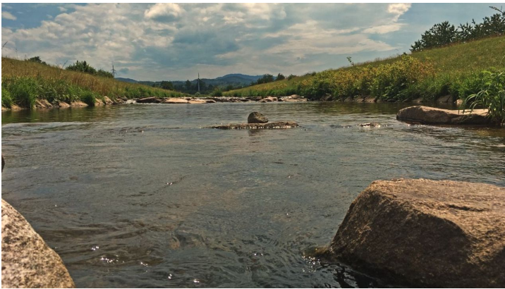
Rensch - © Pro-cyCL Professional cycling Christian Ludewig, www.pro-cycl.de