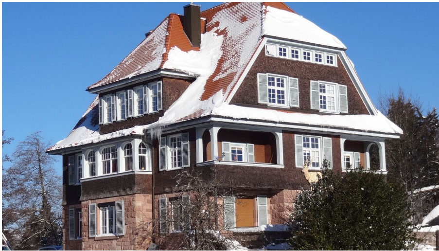
Winter am Ruhestein