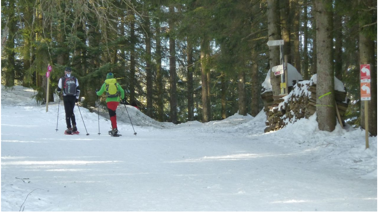
Schneeschuhwanderer unterwegs