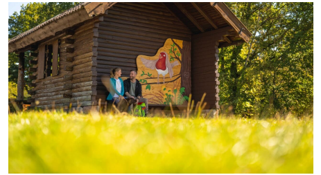
Rastplatz mit Rosi Rotkehlchen auf der Kleinebene