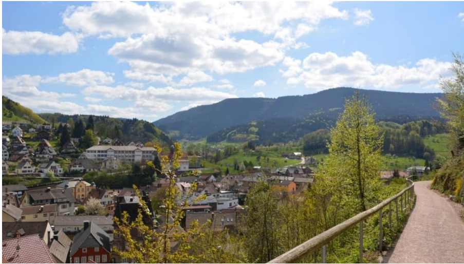
Am Promenadenweg