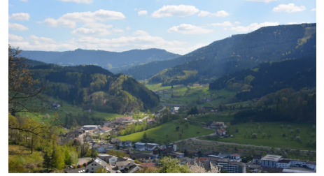
Blick von der Kleinebene