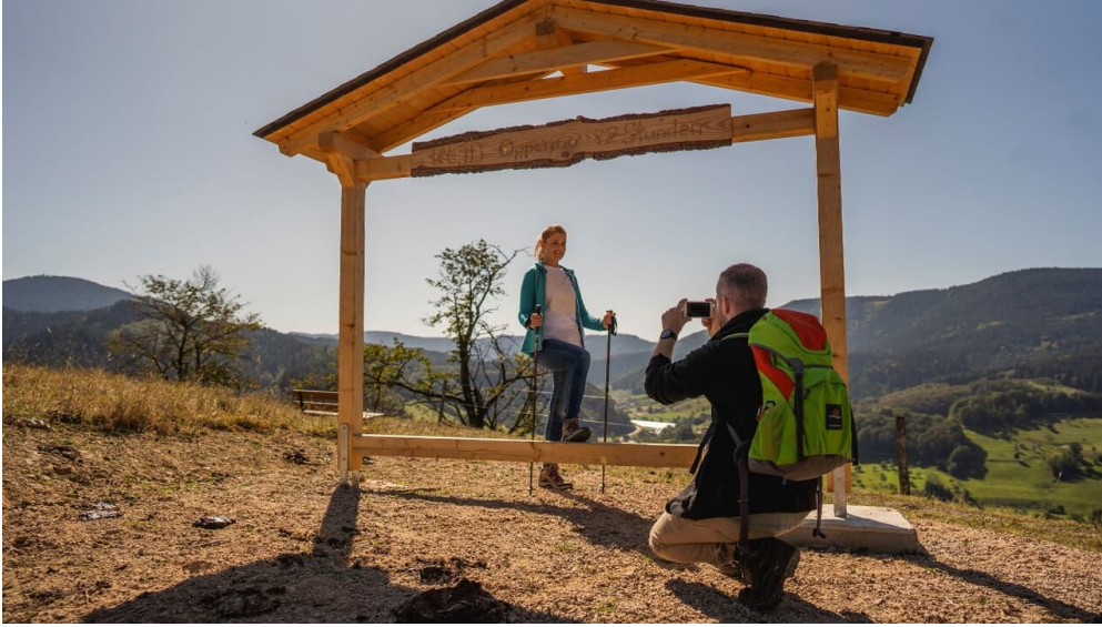
Fotorahmen auf der Kleinebene