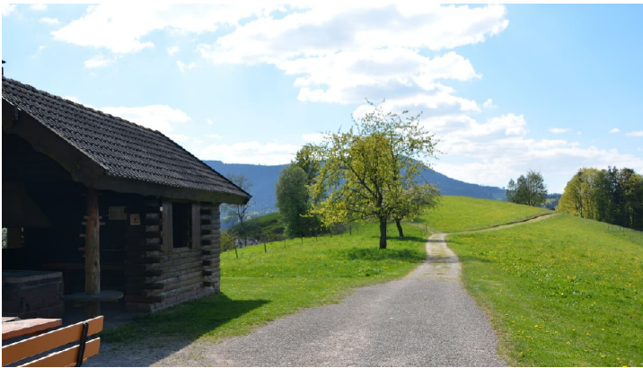
Auf der Kleinebene