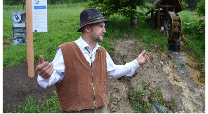
"Müllersohn Karl"