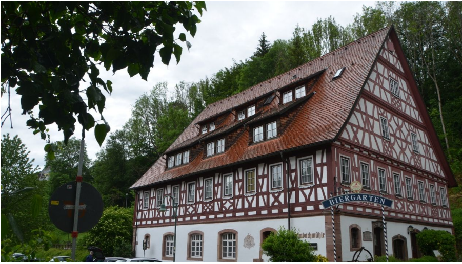
Heimbachmühle Betzweiler