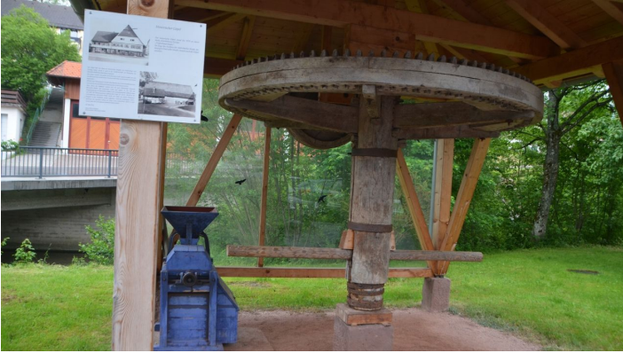
Mühle am Weg