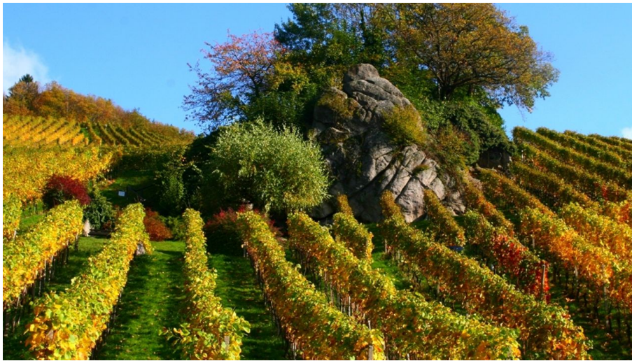
Felsgruppe "Dasenstein" - hier hauste einst die Hex