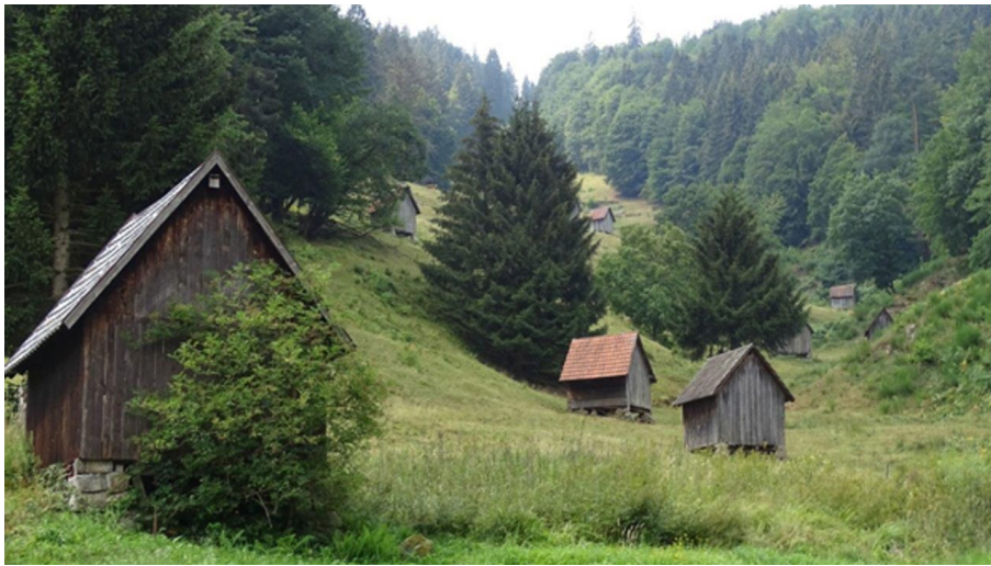
Heuhütten im Sersbachtal bei Forbach-Bermersbach