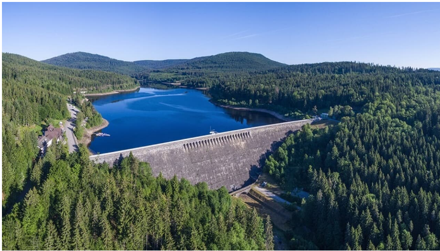
Schwarzenbachtalsperre bei Forbach