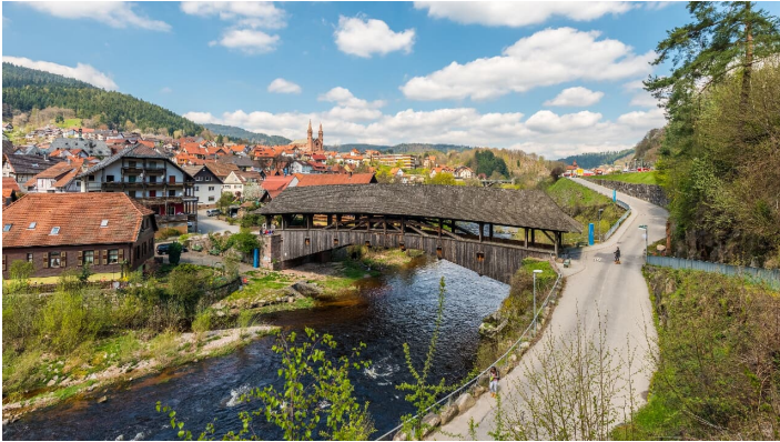
Historische Holzbrücke in Forbach - © compusign.de, Nationalparkregion Schwarzwald - Baiersbronn / Murgtal

Weitere Informationen erhalten Sie über die Touristinformation Forbach (Tel. 07228 390), www.forbach.de und den Zweckverband "Im Tal der Murg" (Tel. 07225 9813121), www.murgtal.org .