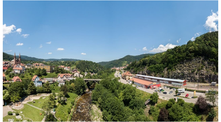
Ortsansicht Forbach - © compusign.de, Nationalparkregion Schwarzwald - Baiersbronn / Murgtal