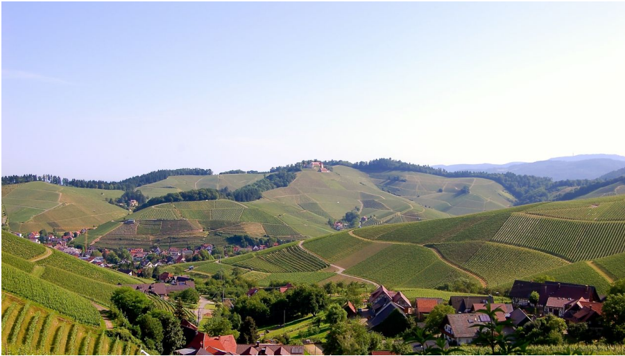
Nadine Fund, Nationalparkregion Schwarzwald - Renchtal/Durbach