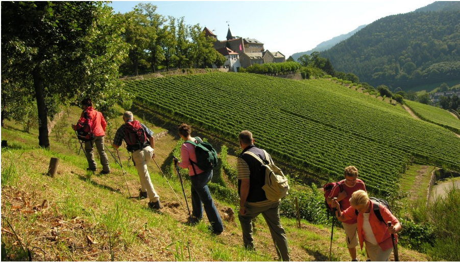
Auf den Spuren der Bergmännle