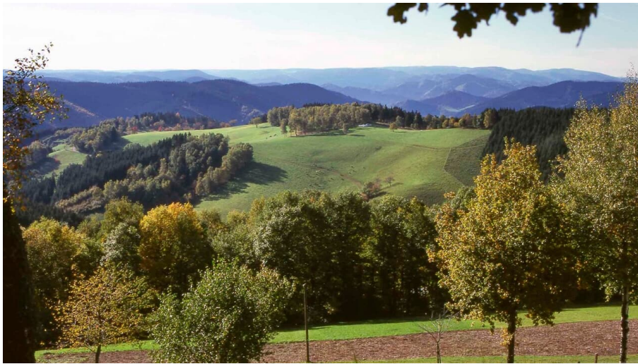
Blick vom Schwarzenbruch - © Josef Oehler, Nationalparkregion Schwarzwald - Wolfstal