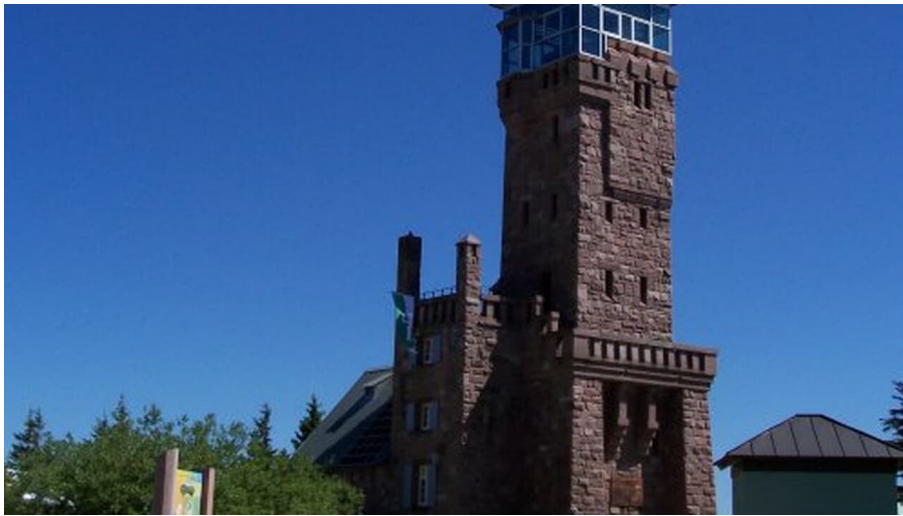
Alexander Trauthwein, Sasbachwalden im Schwarzwald