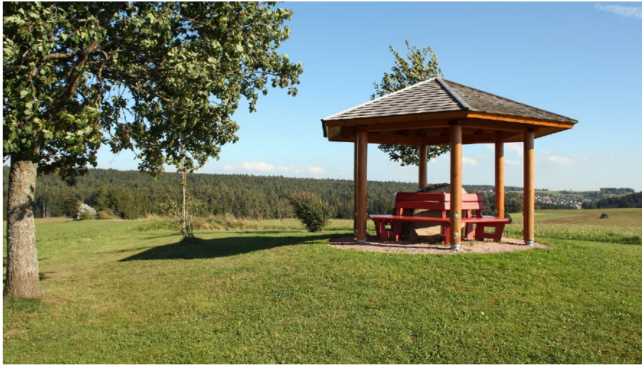
Der Luise-Mayer-Platz in Musbach