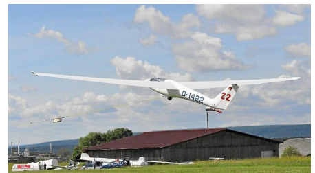
Segelflieger beim Windenstart