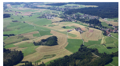
Die Panoramarunde aus dem Segelflieger