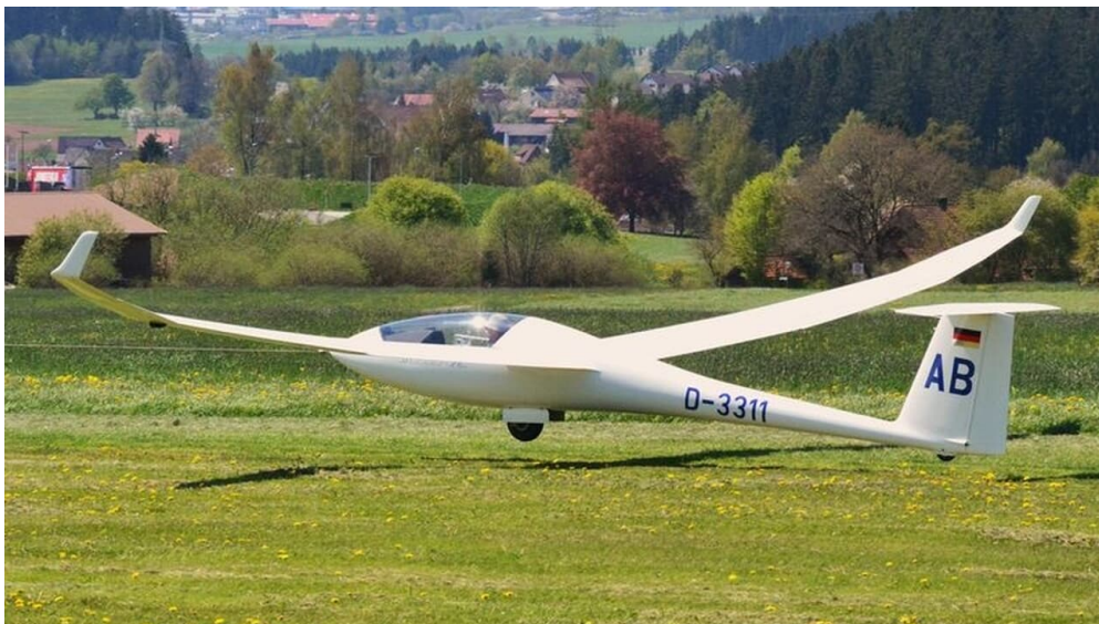
Segelflieger beim Windenstart

kleiner Parkplatz am Ortsrand von Musbach, beim Kinderspielplatz am Wasenweg