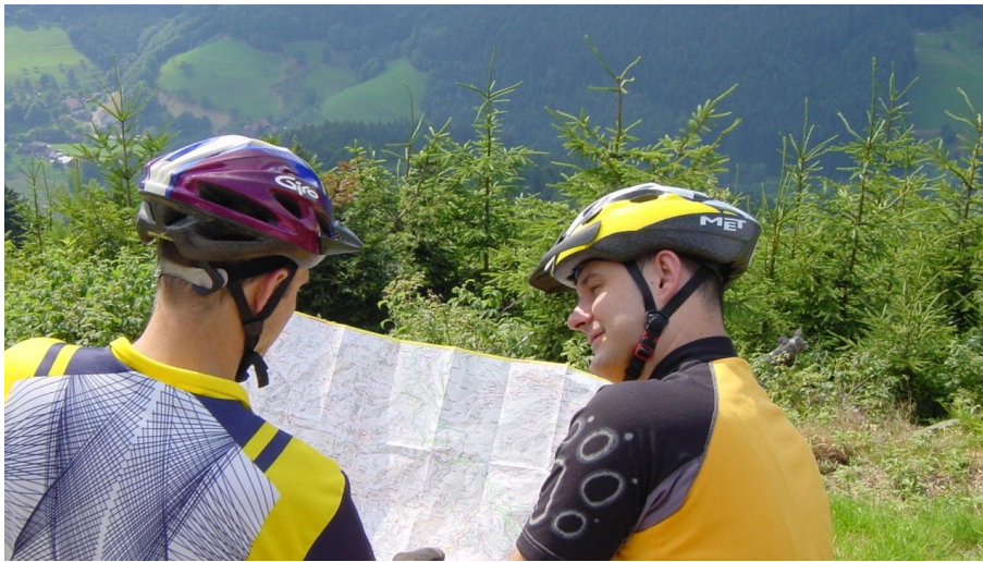
Mountainbiken in Bad Peterstal-Griesbach