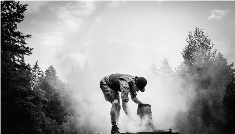
Kohlemeiler - © Stefan Kuhn Photography, Nationalparkregion Schwarzwald - Baiersbronn / Murgtal