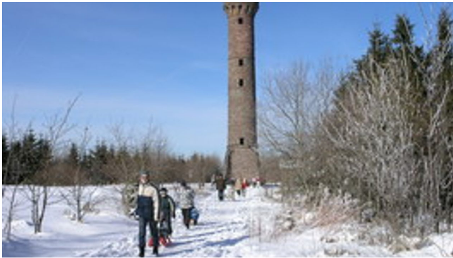
Winterwandern Kaltenbronn