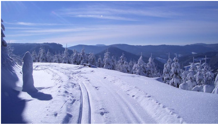
Winterwandern in Bad Peterstal-Griesbach