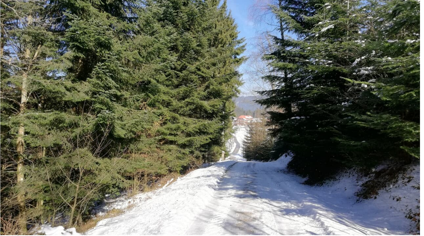
Winterwanderweg im Sonnenschein