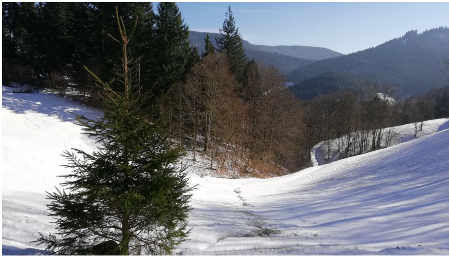
Verschnittene Winterlandschaft