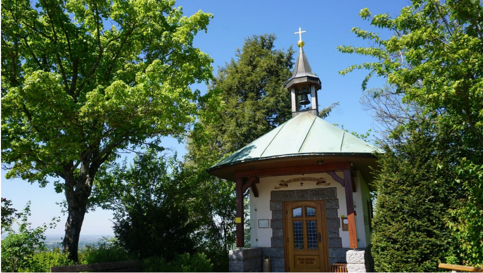
Fatimakapelle - © Nationalparkregion Schwarzwald - Renchtal/Durbach