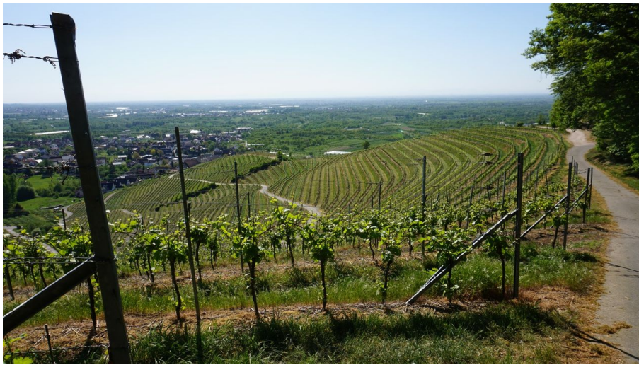
Oberkircher Reblandschaft in Tiergarten