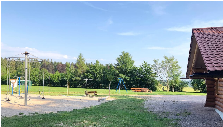
Schützhütte am Oberen Wald