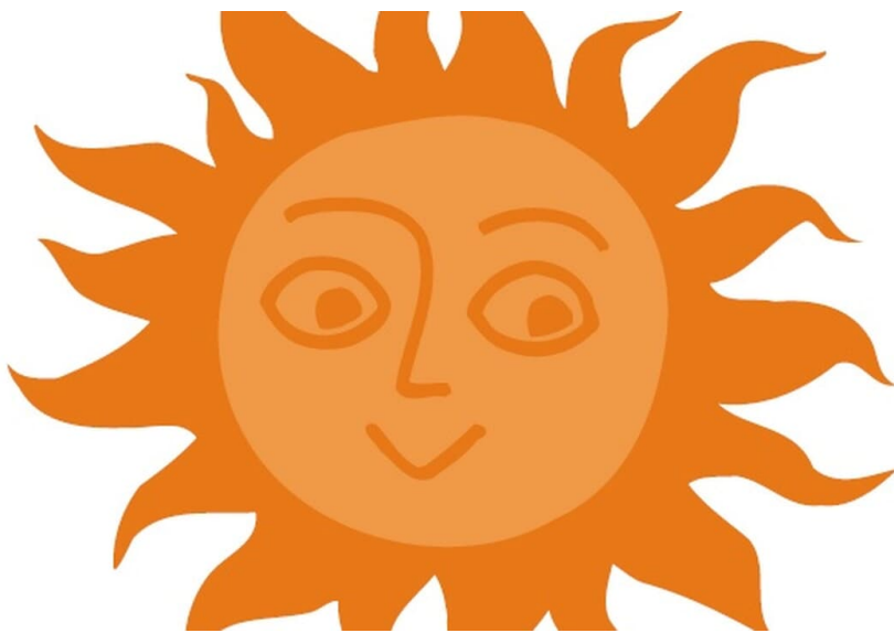
Loßburg Information, Nationalparkregion Schwarzwald - Freudenstadt