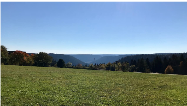
Ausblick von Schömberg