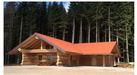
Loßburg Information, Nationalparkregion Schwarzwald - Freudenstadt