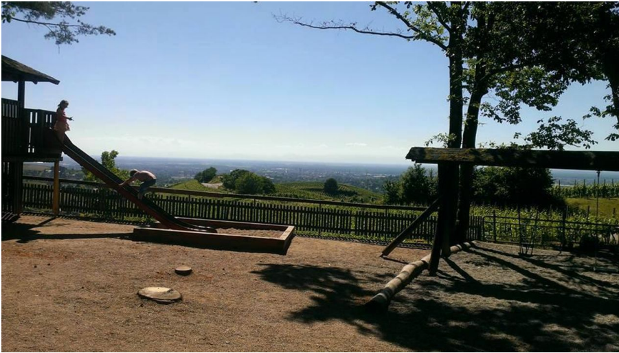
Nadine Fund, Nationalparkregion Schwarzwald - Renchtal/Durbach