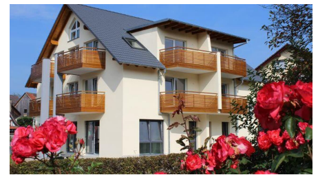
Pflugwirts Gasthaus mit Hotel