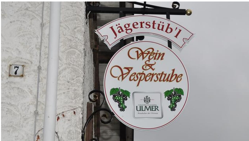
Jägerstüb'l Wein- & Vesperstube