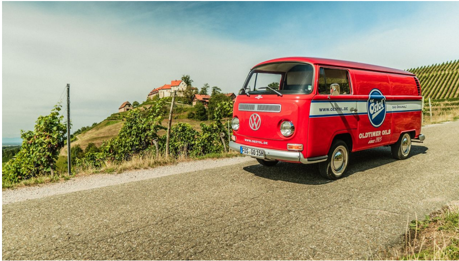
Auf den Spuren der Baiersbronn Classic in der Ortenau - © Baiersbronn Touristik / Max Günter, Nationalparkregion Schwarzwald - Baiersbronn / Murgtal