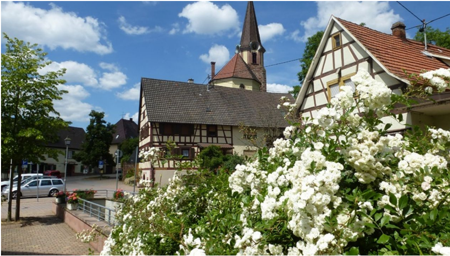
Michelbach Lindenplatz