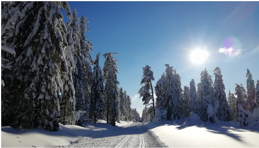
Kaltenbronn Langlauf Loipe - © Katrin Schmitt, Nationalparkregion Schwarzwald - Baiersbronn / Murgtal