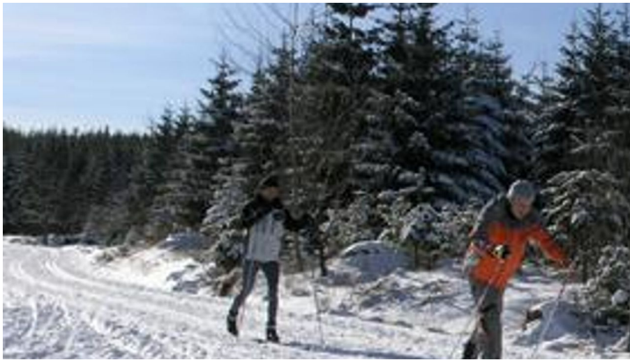
Kaltenbronn Langlauf