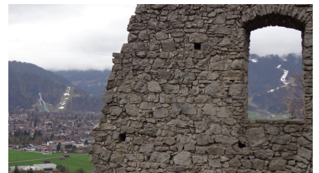
Burgruine Werdenfels