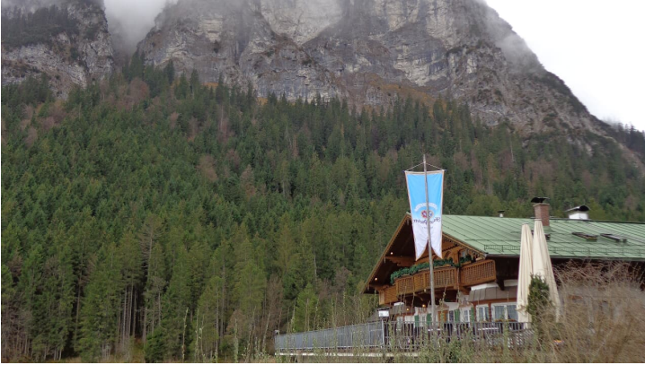
Pflegensee und Königstand - © Bettina Plank, GaPa Tourismus