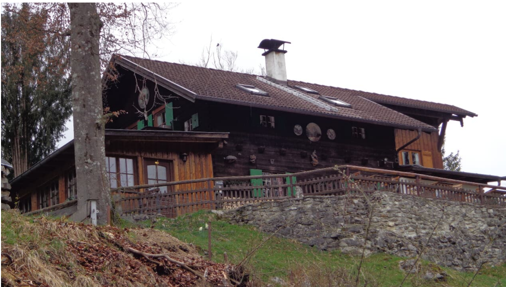
Werdenfeller Hütte