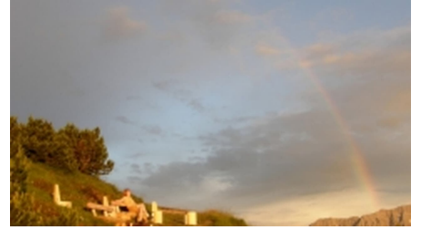
Naturkino am Wank