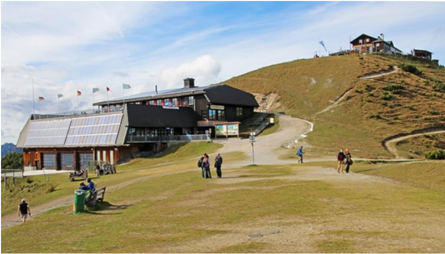
Wank Bergstation, Sonnenalm und Wankhaus