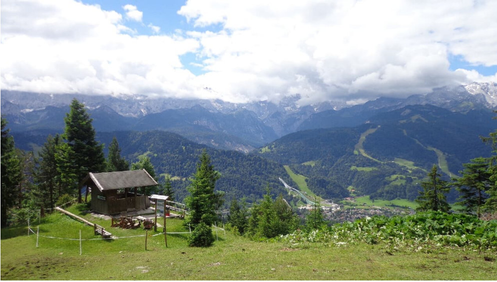
Bettina Plank, GaPa Tourismus