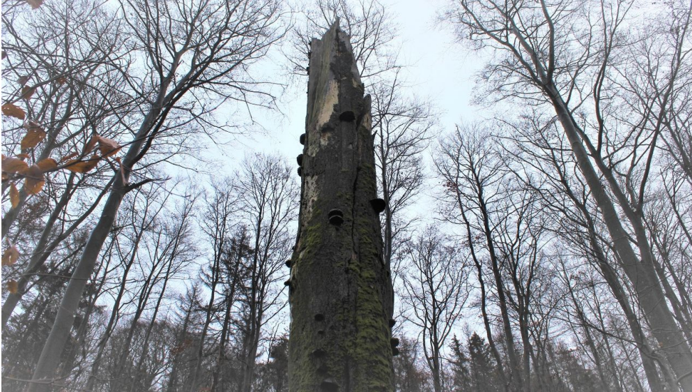
Zunderschwämme an altem Buchenstamm - © Kurt Thurow, Edersee | Deine Region: wild, bunt, gesund.