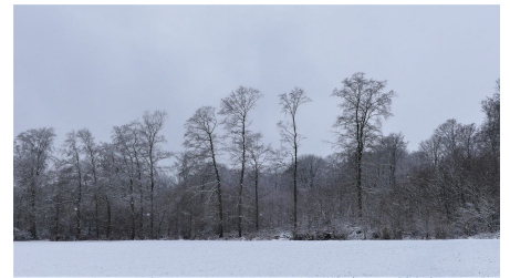
Winterlicher Buchenwald