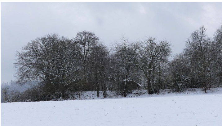
Jägersburg im Schnee - © Gereon Schoplick, Stadtmarketing Bad Wildungen