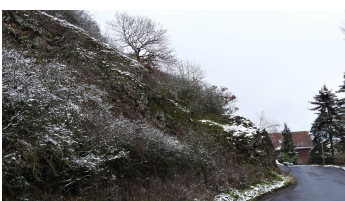
Diabasklippe in Odershausen