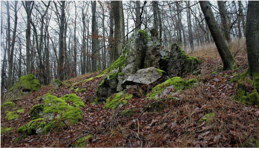
Felsen am Auenberg - © Kurt Thurow, Stadtmarketing Bad Wildungen