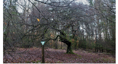
Naturdenkmal Suntelbuchen - © Kurt Thurow, Stadtmarketing Bad Wildungen