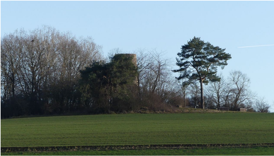
Braunauer Warte mit vorgelagertem Wäldchen - © Gereon Schoplick, Stadtmarketing Bad Wildungen, Edersee | Deine Region: wild, bunt, gesund.