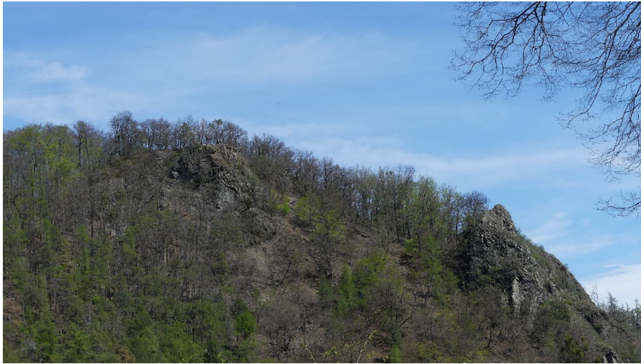
Bilsteinklippen, vom Wildetal aus gesehen - © Gereon Schoplick, Stadtmarketing Bad Wildungen, Edersee | Deine Region: wild, bunt, gesund.