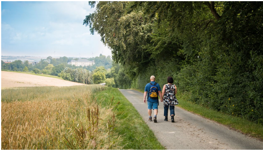
Blick aufs Schloss Fürstenberg