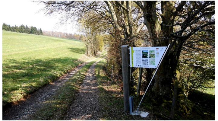
Wegweiser Goldspur Eimelrod