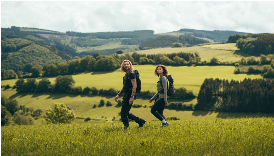
Wanderpaar in Wiesenlandschaft