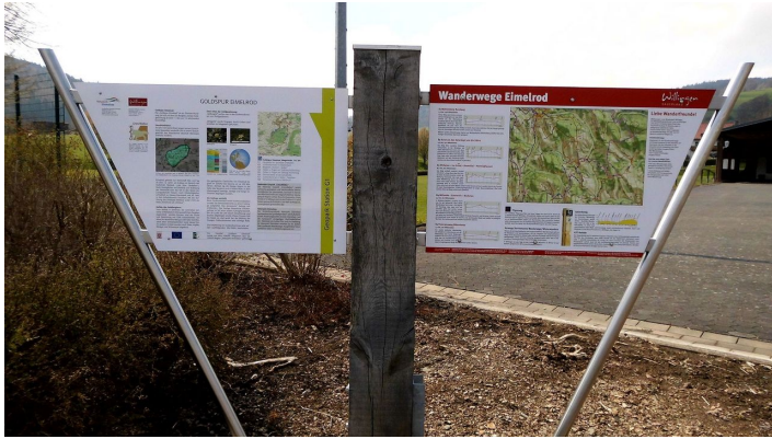
Wandertafel in Eimelrod

Weitere Infos / Links: www.willingen.de/wandern