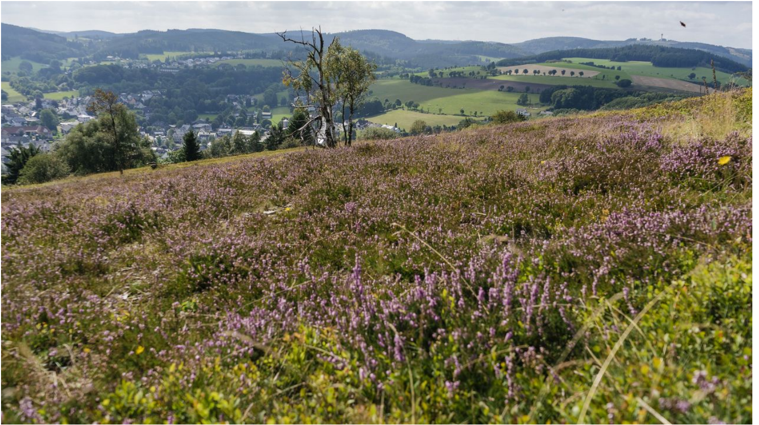
Heidelandschaft auf dem Osterkopf