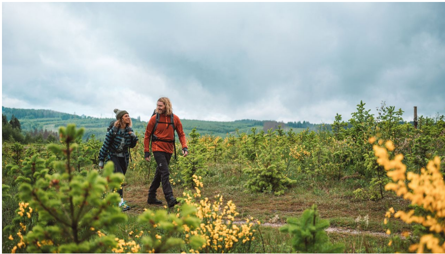
Wanderpaar auf einem Hoehenzug im Sauerland