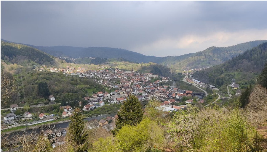
Forbach-Blick von unterhalb des Kuckucksfelsen