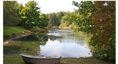
Waldsee Lützenhardt