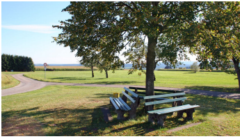
Untermusbach - © Jens Teufel, Nationalparkregion Schwarzwald - Freudenstadt