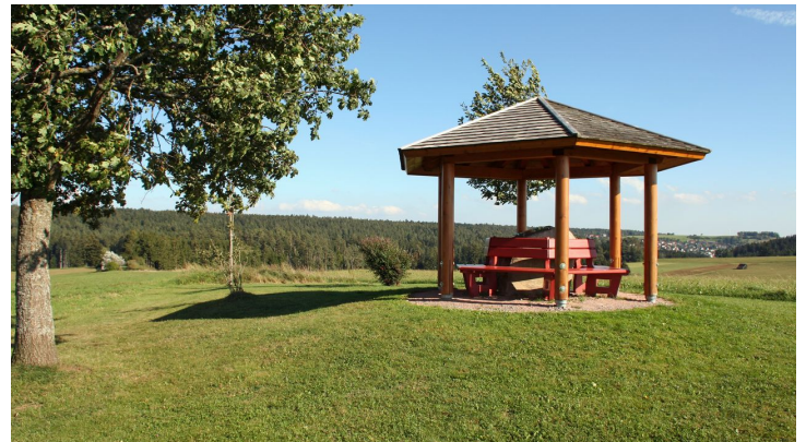
Luise-Mayer-Platz Musbach