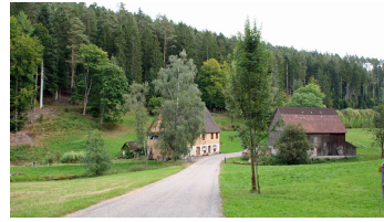
Zinsbachmühle - © Jens Teufel, Nationalparkregion Schwarzwald - Freudenstadt