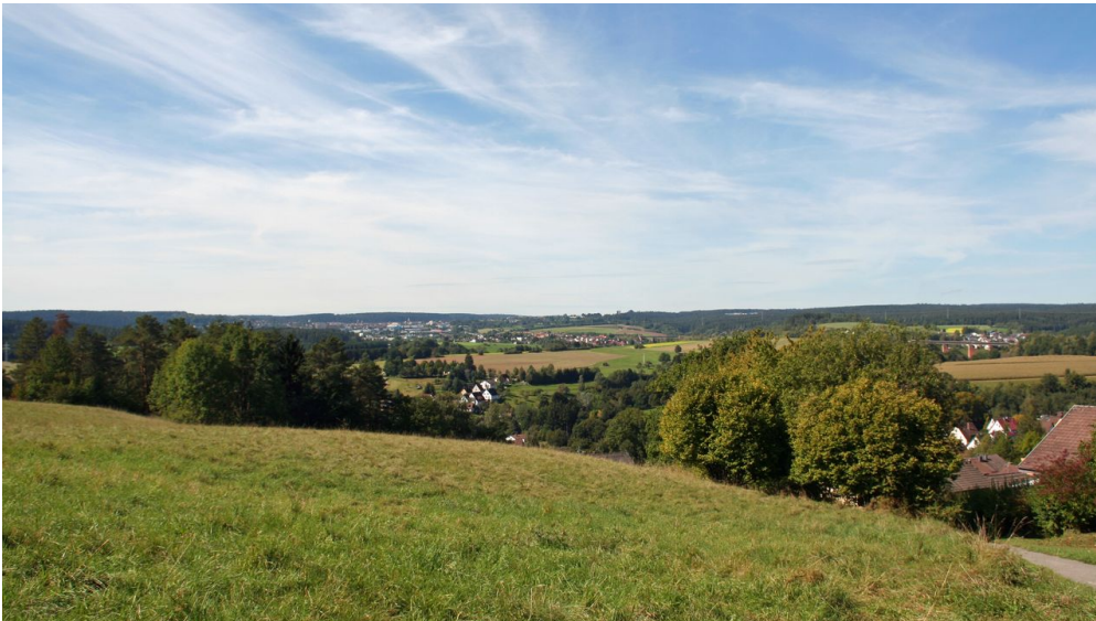
Blick von Aach nach Freudenstadt

Radkarte Landkreis Freudenstadt (LGL, 1:50.000), € 7,20