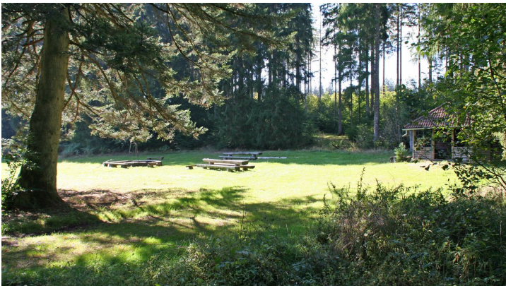
Stockwiesenhütte bei Kälberbronn