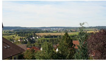
Blick von Aach nach Freudenstadt