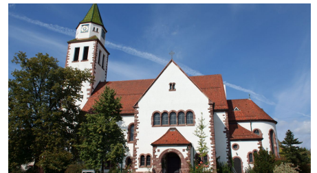
Kirche Pfalzgrafenweiler