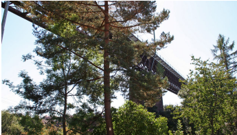
Wittlensweiler Viadukt