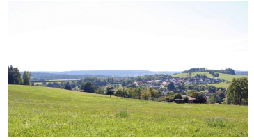
Blick Richtung Wittlensweiler