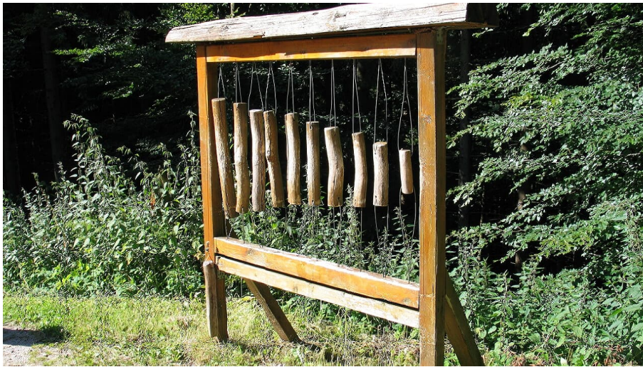
Forbach-Herrenwies-Station Waldlehrpfad - © Nationalparkregion Schwarzwald - Baiersbronn / Murgtal