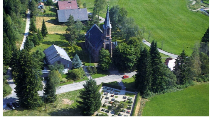
Forbach-Herrenwies-Luftbild Kirche - © Thomas Hudeczek, Nationalparkregion Schwarzwald - Baiersbronn / Murgtal