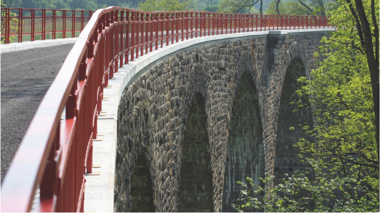
Viadukt in Heiligenhaus - © Stadt Heiligenhaus