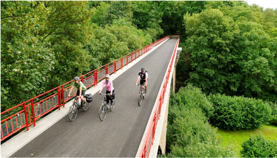
Radfahrende auf dem Viadukt in Heiligenhaus