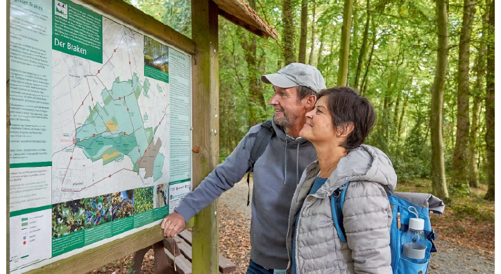
Wandern im Naturwald Braken