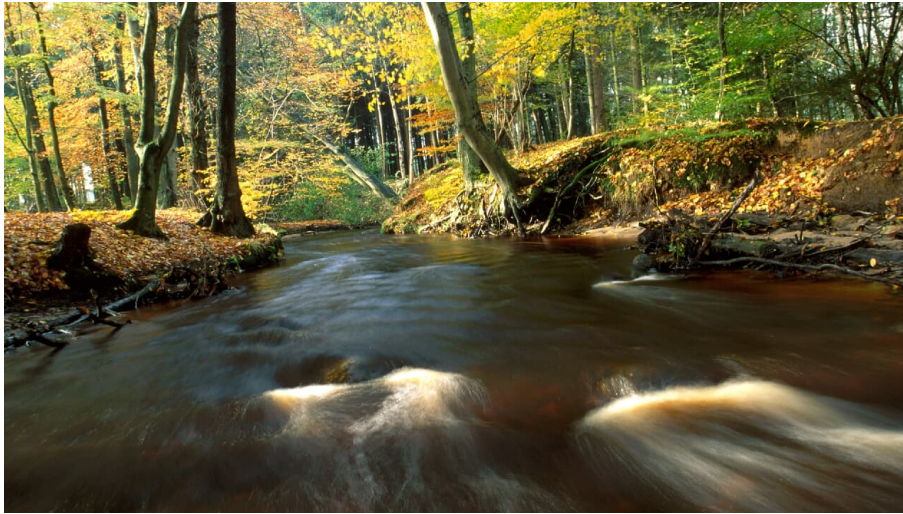
Steinbecktal in Harsefeld