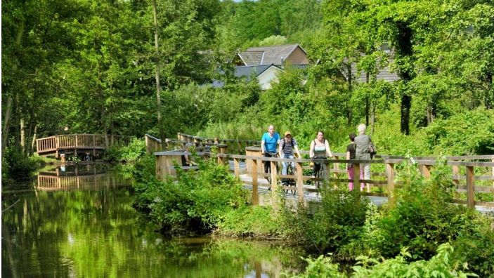
Radler im Klosterpark Harsefeld