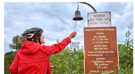
Läuten der Glocke bei der Prahmfähre Brobergen