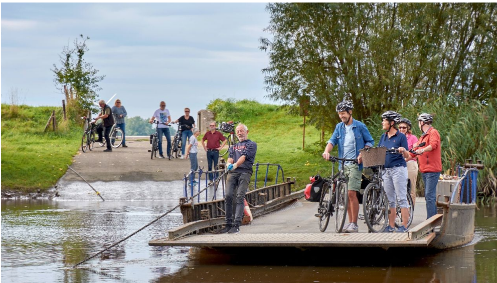
Überfahrt mit der Prahmfähre Gräpel