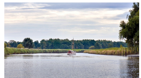
Segelboot auf der Oste