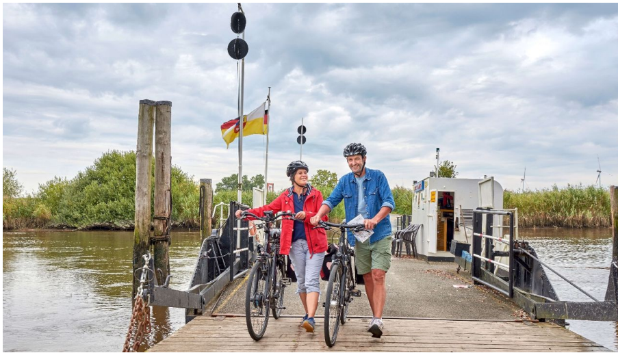
Passagiere auf der Fähre Brobergen