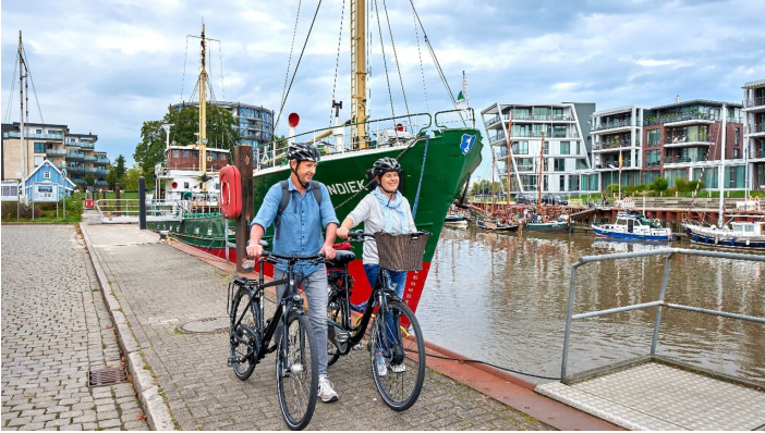
Stader Hafen Elberadweg