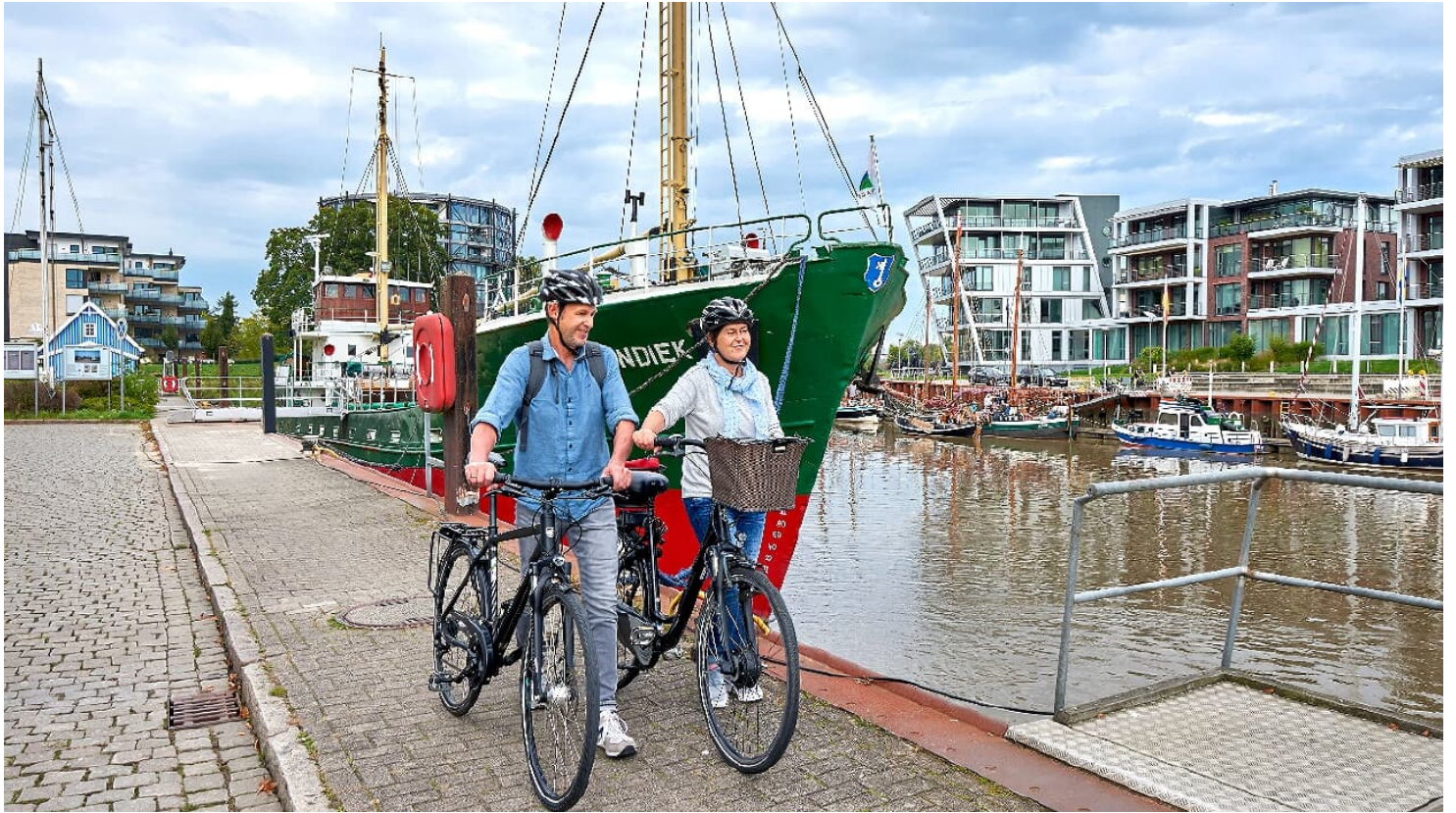
Stader Hafen Elberadweg