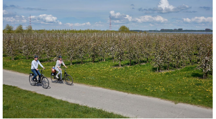
Radfahrer an der Elbe zur Blütezeit