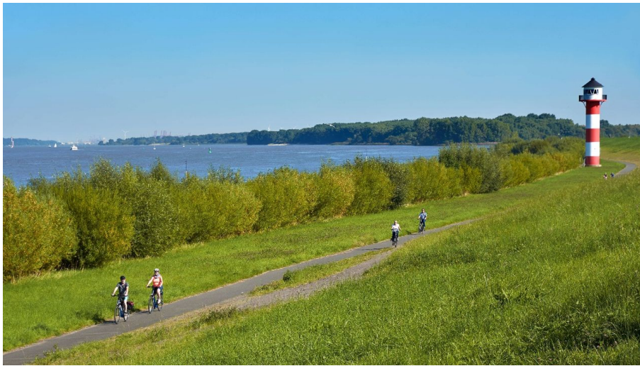
Radfahrer an der Elbe