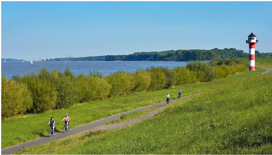
Radfahrer an der Elbe