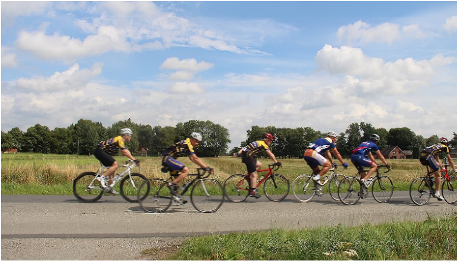
Rennradfahrer in der Urlaubsregion Altes Land am Elbstrom