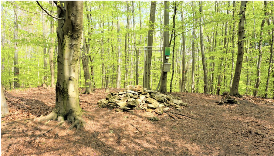
Gipfelkreuz auf dem Eilumer Horn