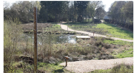
Impression Torfstichpfad Mulsum