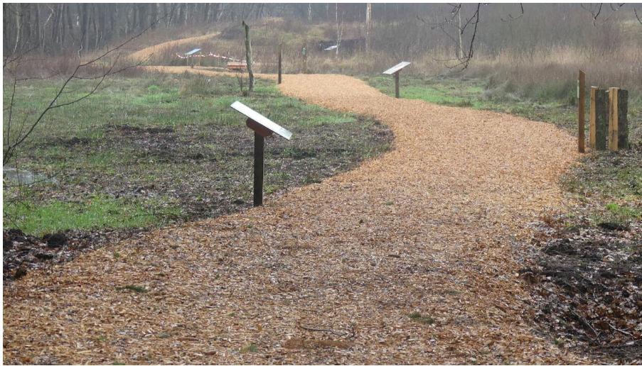
Weg Torfstichpfad Mulsum