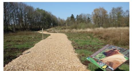
Erlebnisstation Torfstichpfad Mulsum