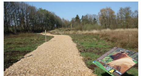
Erlebnisstation Torfstichpfad Mulsum