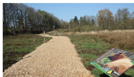
Erlebnisstation Torfstichpfad Mulsum