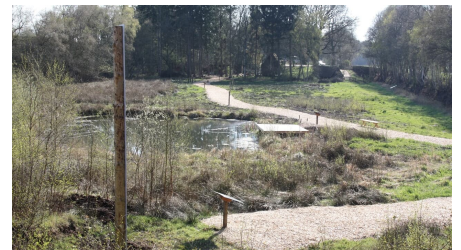
Impression Torfstichpfad Mulsum