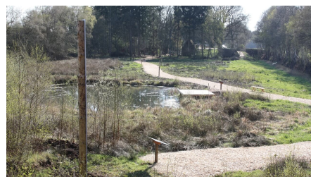
Impression Torfstichpfad Mulsum