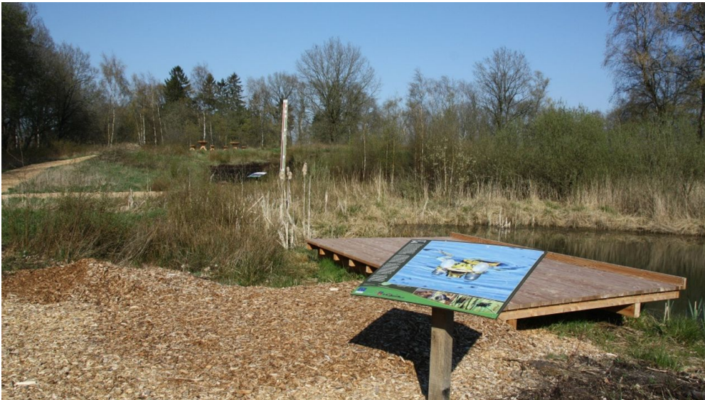
Infostation Torfstichpfad Mulsum

Der Torfstichpfad befindet sich in unmittelbarer Nähe zum Radfernweg "Vom Teufelsmoor zum Wattenmeer" und liegt direkt am Nordpfad "Hinterholz und Hohenmoor".