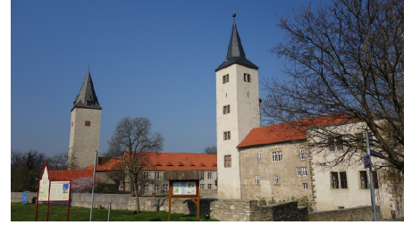
Schloss Hessen - © Thomas Kempfer, Elm-Freizeit, Allianz für die Region GmbH