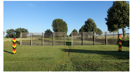
Grenzdank Mattierzoll - © Thomas Kempfer, Elm-Freizeit, Allianz für die Region GmbH