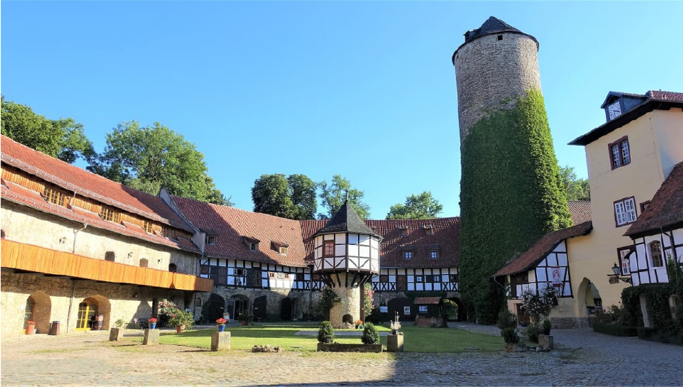
Wasserschloss Westerburg