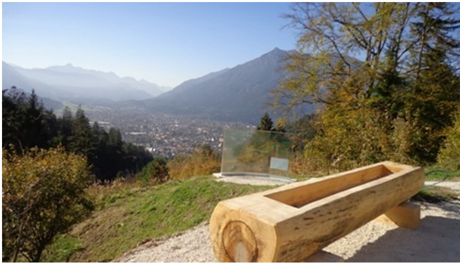
Aussicht auf der Tannenhütte - © Bettina Plank, GaPa Tourismus GmbH